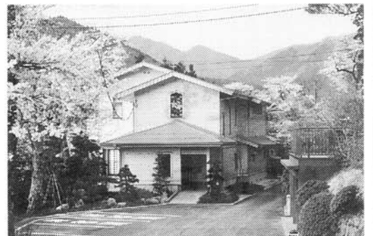
道志川の清流を守る水源林管理所。木材は水源林から切出した検を使っている。

中には発がん性の疑いのある物質もあり、トリハロメタンを少なくする研究や、塩素に替わる消毒剤の研究が行われていますが、今のところ決定版は見つかっていません。 さて、このトリハロメタンですが、これまでが暫定基準という扱いでした。しかも他の基準値は、年間の最大値を超えてはならない値なのに、トリハロメタンの場合には年間の平均値が基準を超えなければよいことになっていました。しかし、今回の基準改正でトリハロメタンも他の項目と同じく、最大値が基準を超えてはならないことになりました。 この他に従来からあった項目で基準が強化されたのは、鉛、ヒ素、マンガンの金属類と、合成洗剤で多く使われている陰イオン界面活性剤です。この陰イオン界面活性剤については、私たちの主張する毒性による基準ではなく、改正前と同じく「泡がたないこと」を目的とした基準である点に問題が残ります。